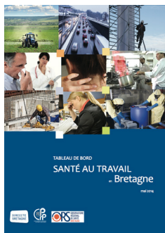
TABLEAU DE BORD SANTÉ TRAVAIL EN BRETAGNE

Après la production d'un premier bilan régional en 2010 et de diagnostics locaux à l'échelle des zones d'emploi en 2012, l'Observatoire Régional de Santé de Bretagne a produit, à la demande de la Direccte, une synthèse de la situation régionale en matière de