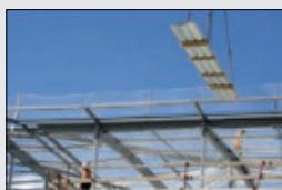
Quelques exemples de mesures de prévention.